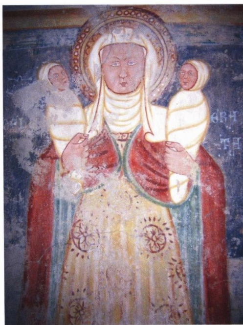
Santa protettrice contro i pericoli del parto e della mortalità infantile